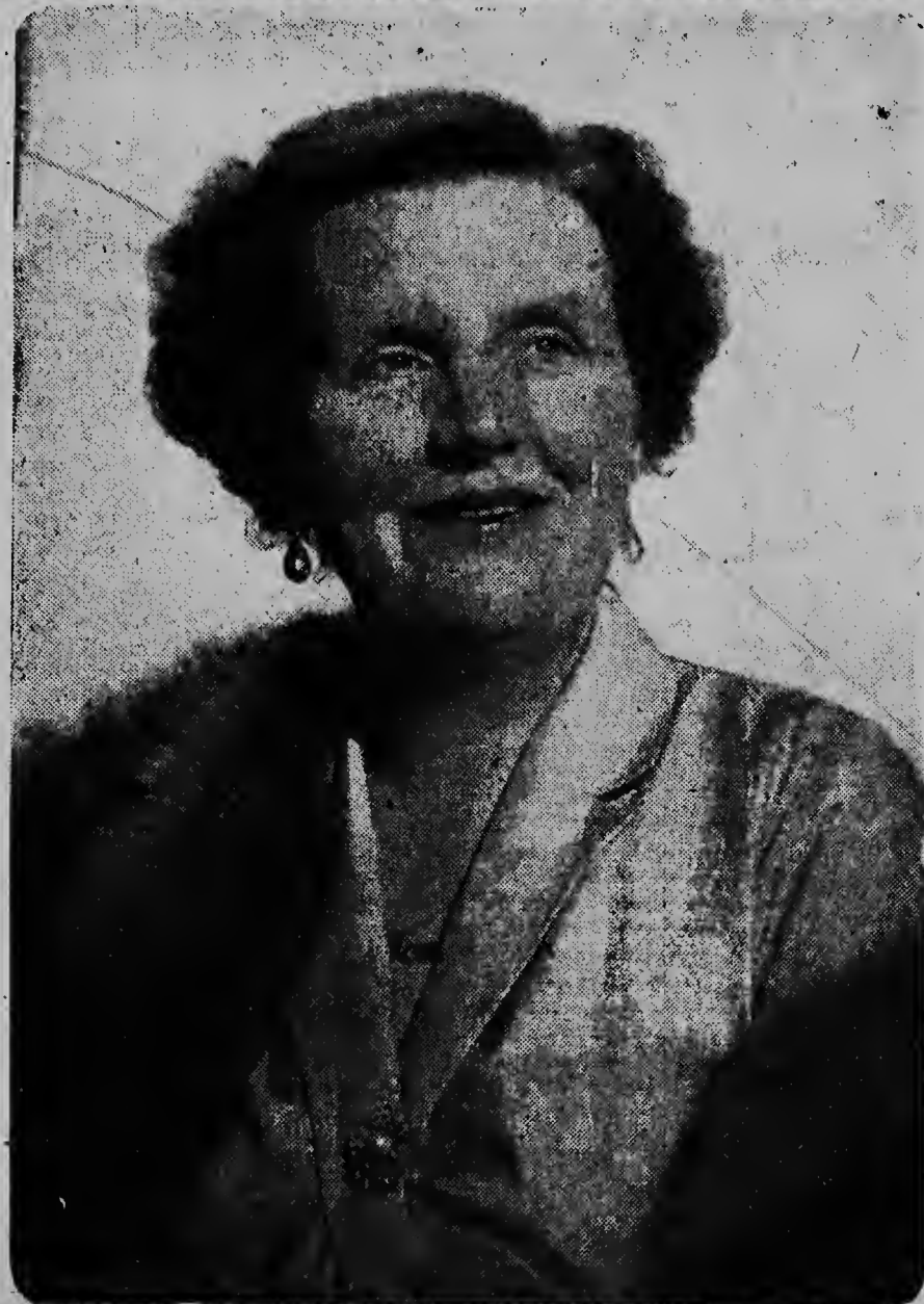
H. M. KONINGIN JULIANA

Ten opzichte van dit bezoek kan men natuurlijk veel houdingen aannemen en vele gedachten koesteren. Zeer velen zullen zich afvragen: Wat is de zin van dit bezoek; welke overweging steekt er achter. Want groot is het aantal redenen waarom vorsten en vorstinnen de grenzen van hun land overschrijden om elders bezoeken af te leggen. Soms doen zij het uit beleefdheid, dikwijls ook zijn er grote belangen bij betrokken, ook wel is het niet méér dan een inspectietocht. Wordt dit bezoek om één van deze redenen gebracht? Neen, zeggen wij!